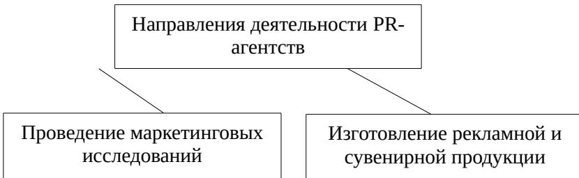
Рис.1. Направления деятельности PR-агентств

В названиях рисунков, состоящих из нескольких строк, не должно быть переносов (межстрочный интервал – 1,5), не допускается подчеркивание, использование курсива и жирного шрифта. В качестве иллюстраций могут выступать диаграммы, схемы, карты, картосхемы, графики и др. Однако все указанные виды графического (иллюстративного) материала по тексту обозначаются как рисунки.