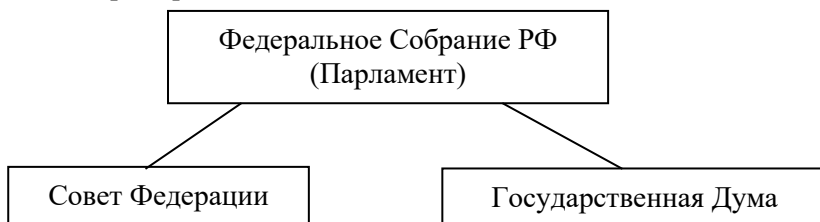
Рисунок 1 - Структура парламента Российской Федерации (Подпись рисунка по центру)

В названиях рисунков, состоящих из нескольких строк, не должно быть переносов (межстрочный интервал – 1,5), не допускается подчеркивание, использование курсива и жирного шрифта. В качестве иллюстраций могут выступать диаграммы, схемы, карты, картосхемы, графики и др. Однако все указанные виды графического (иллюстративного) материала по тексту обозначаются как рисунки.