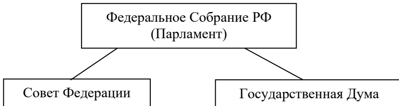
Рисунок 1 - Структура парламента Российской Федерации

В названиях рисунков, состоящих из нескольких строк, не должно быть переносов (межстрочный интервал – 1,5), не допускается подчеркивание, использование курсива и жирного шрифта. В качестве иллюстраций могут выступать диаграммы, схемы, карты, картосхемы, графики и др. Однако все указанные виды графического (иллюстративного) материала по тексту обозначаются как рисунки.