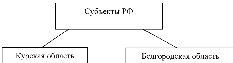
Рисунок 1 – Субъекты Российской Федерации