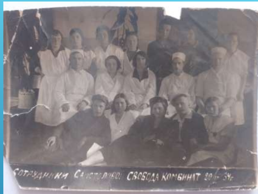
СОТРУДНИКИ САНАТОРИЯ СВОБОДА КОМБИНАТ 20-34

САНАТОРИЙ «СВОБОДА» ДЛЯ БОЛЬНЫХ ТУБЕРКУЛЕЗОМ, 1930-Е ГОДЫ АРХИВ СЕМЬИ АРТЕМОВЫХ С. ДОЛГОЕ ЗОЛУХИНСКОГО РАЙОНА