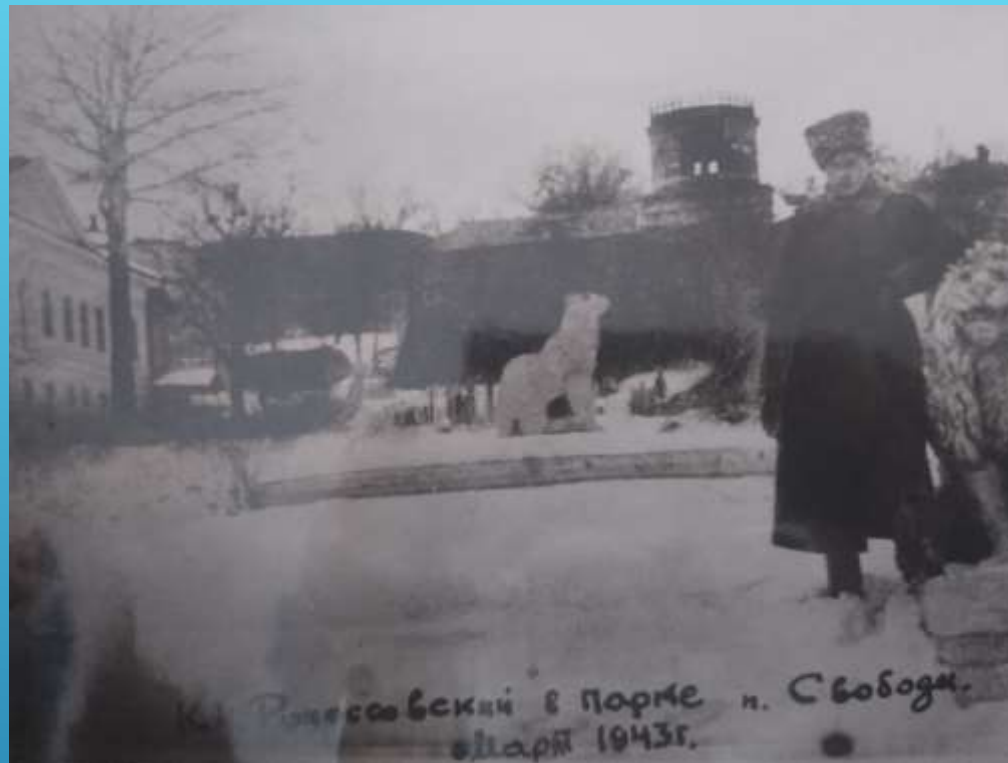
МОНАСТЫРЬ КОРЕННАЯ ПУСТЫНЬ 1940-Е ГОДЫ. К.К. РОКОССОВСКИЙ, МАРТ 1943Г.