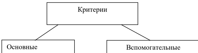
Рисунок 1 – Критерии оценки важности