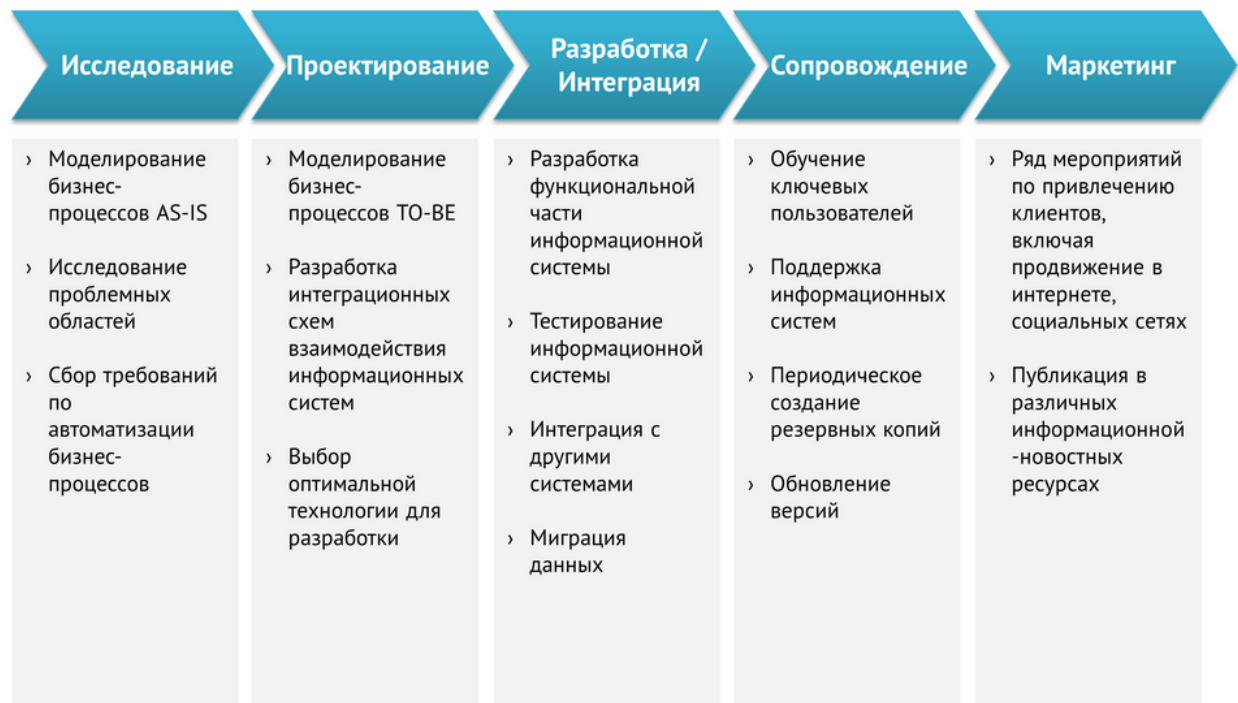
Рисунок 1 – Этапы автоматизации бизнес-процессов