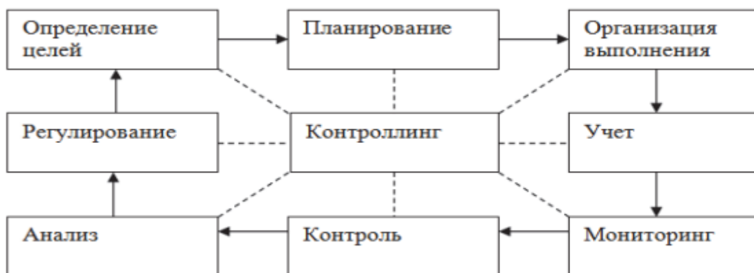
Рисунок 1 – Цикл контроллинга на предприятии [2].

На рисунке 1 представлена структура цикла контроллинга на предприятии.